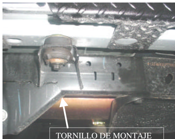
Diagrama de Ensamble :