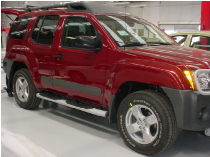
Estribo instalado, lado pasajero.